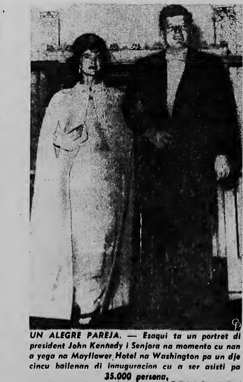
UN ALEGRE PAREJA. — Esqui ta un portret di president John Kennedy i Senjora na momento cu nan a yega na Mayflower Hotel na Washington pa un dje cinco bailenan di inauguracion...